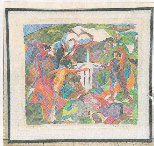
Et af Helle Thorborgs collagearbejder på kinesisk papir, hun selv bragte med hjem 1995. Det er tydeligvis Thy, og midt i billedet ses Freden som den hvide figur, der angribes fra alle sider.